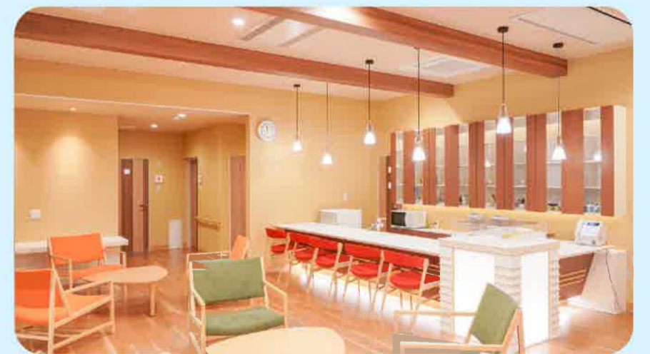
校庭には 平屋を増築しました!