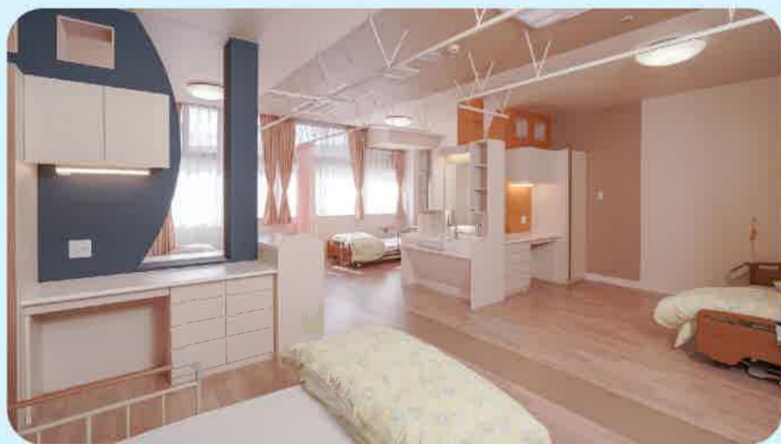
小学校の教室を 居室に!