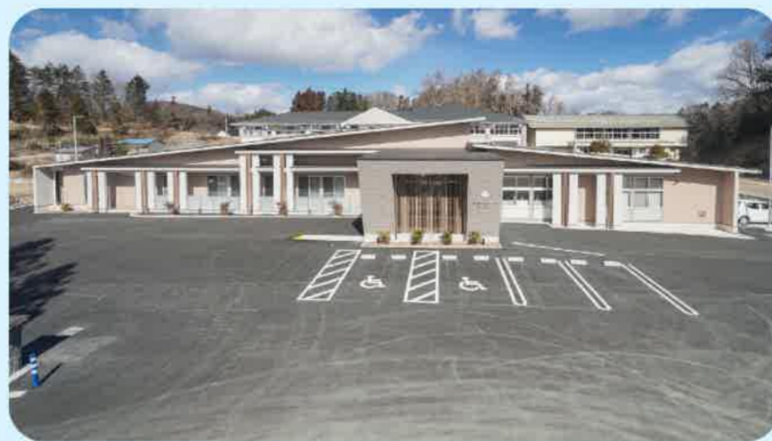
あちこちに 小学校の名残があります。